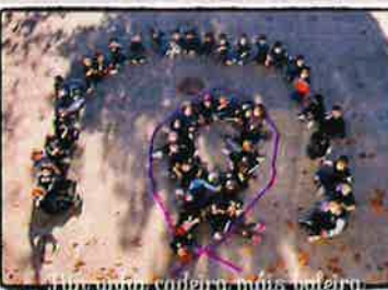
'ENLAZANDO IGUALDADE! Coa presente fotografía preténdese concienciar dende idade temperás a importancia da tolerancia, do respecto e da igualdade de xéneros. A imaxe só é un pequeno reflexo do que se t... Ver máis'