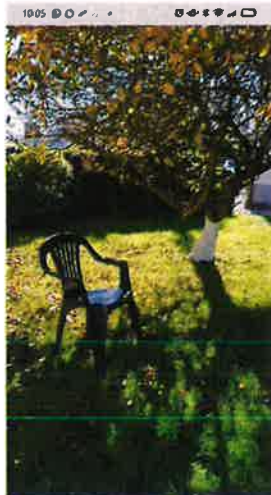
'A OSCURIDADE QUE DEIXA A PERDA! A crúa realidade dunha cadeira baleira, a perda de ser quando su coñecido'