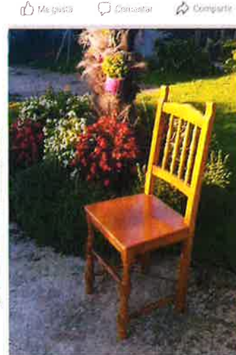
'VISIBILIDADE Á CADEIRA! Un raio de luz e flores para a ausencia'