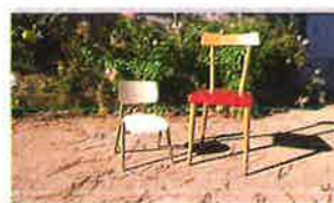
'NIN MÁIS NAI NIN MÁIS NEN@S! Na fotografía aparecen dúas cadeiras baleiras, unha máis grande que representa ás mulleres e outra máis pequena que representa aos nenos e nenas que sofren a violencia c... Ver máis'