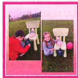
'XOGANDO CUNHA CADEIRA BALEIRA! Aquí dous nenos nunha tarde calquera xogando cunha cadeira baleira. Xogan a adornala cunha estrela na que debuxan un corazón, a sentar unha boneca... Logo farán dela un... Ver máis'